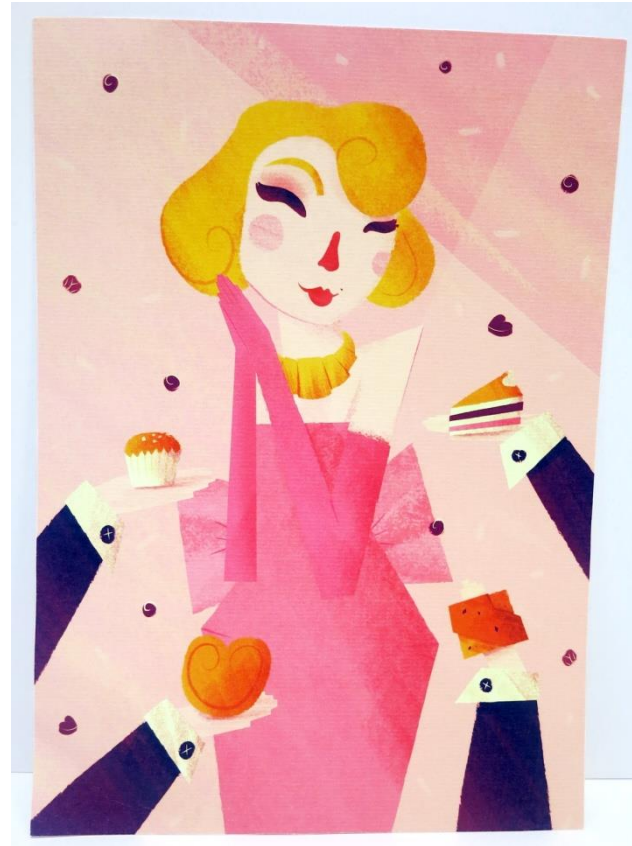
SWEET MARYLIN FABIOLA CORREAS