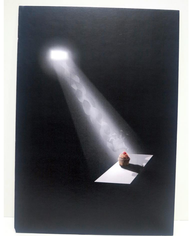
TENTACIÓN ELOY COMPÉS